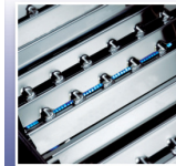
Système de cuisson Flav-R-Wave™ en acier inoxydable