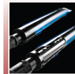
Système de brûleur Dual-Tube en acier inoxydable